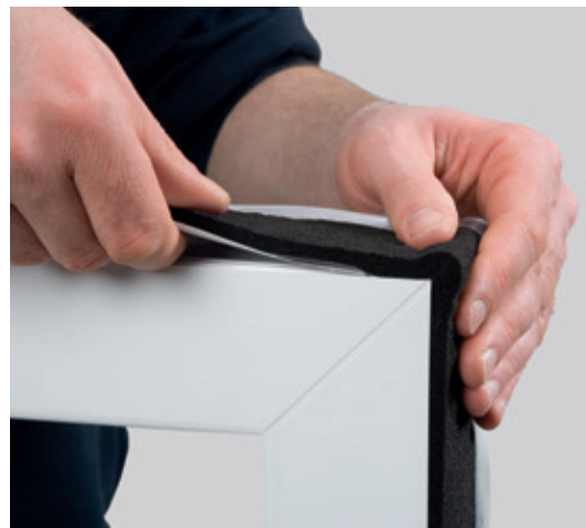
Ejemplo de instalación: ISO-BLOCO ONE

** El movimiento de elementos estructurales y los cambios de longitud temporales de las juntas deben tenerse en cuenta para dimensionar correctamente la cinta.