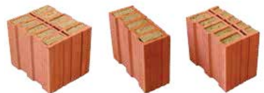
AE/LZ = kombinierter Eck- und Laibungsziegel